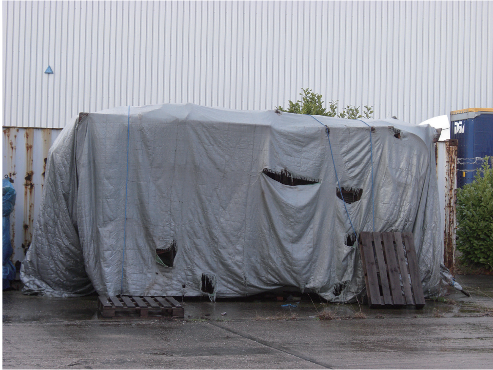
写真1. シートに覆われた処分される大型脱穀機（ミュージアム・リソースセンター，コルチェスター）2009年1月。

史館は、2008（平成20）年に閉校した旧小学校の校舎を活用して2012（平成24）年に開館した。同館は、旧市町村の民俗資料館や収蔵庫など7施設のコレクションを集約して収蔵・公開している（金山，2014a）。